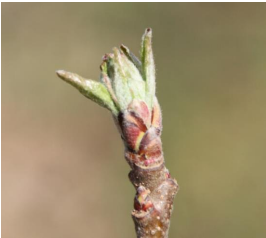
24.03.2020 orecchietti di topo