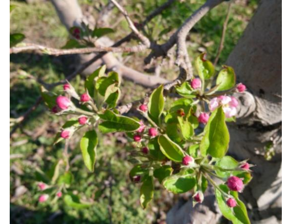
10.04.2020 bottoni rosa