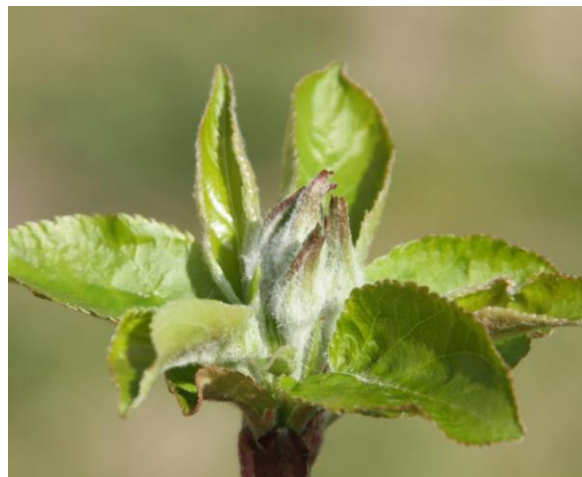
02.04.2020 mazzetti affioranti