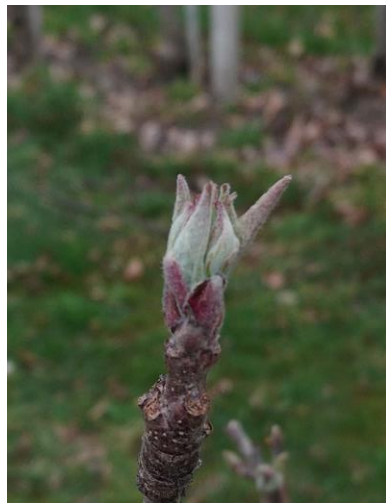
orecchietti di topo