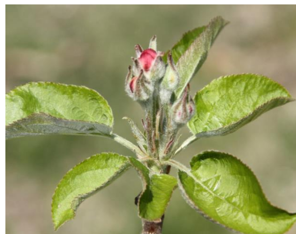
10.04.2020 mazzetti divaricati