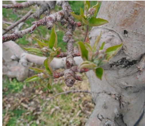
30.03.2020 mazzetti affioranti