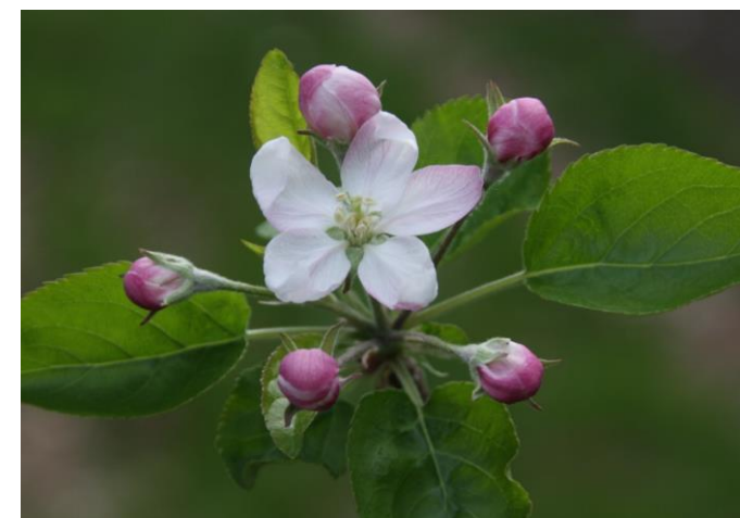
17.04.2020 a partire dalla piena fioritura