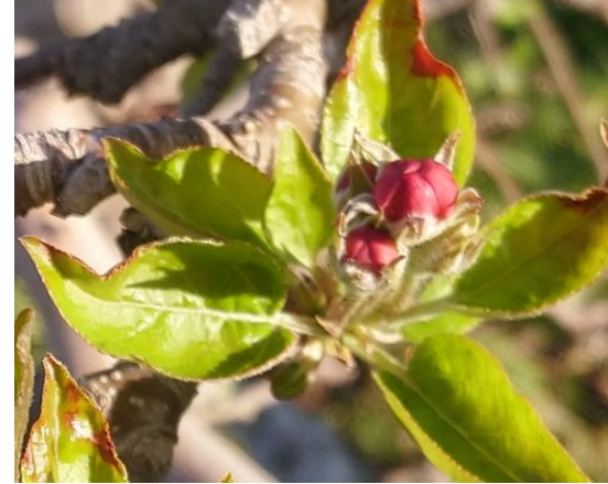
06.04.2020 mazzetti divaricati