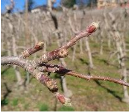
16.03.2020 punti verdi